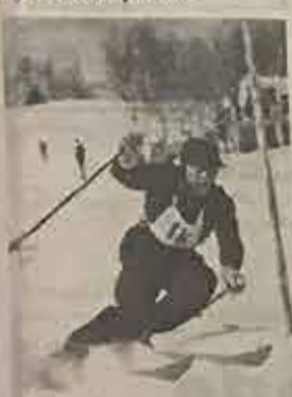
HASSE OLOFSSON - 50-talats stora stjärna och med åtta SM-guld "nära" av fjällvindarna.